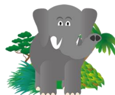
Olifant 2,5 - 4 jaar

De namen van de dieren (groepen) komen weer terug in het logo, samen vormen zij KindRijk Jungle.