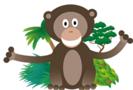
Aap 0 -1,5 jaar

KDV Olifant: Dagopvang voor kinderen van 2,5-4 jaar