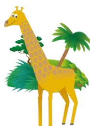
Giraf 1,5 - 2,5 jaar