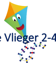
De Vlieger 2-4

KindRijk wil graag dicht naast de school staan waar we mee samenwerken, om elkaar goed te kunnen begrijpen en met elkaar de doorgaande lijn vorm te geven moeten we van elkaar weten waar we mee bezig zijn en wat onze doelen zijn. Er is veelvuldig overleg met de directeur en de leerkrachten van basisschool De Brugge.