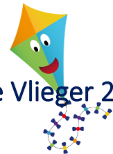
De Vlieger 2-4

KindRijk wil graag dicht naast de school staan waar we mee samenwerken, om elkaar goed te kunnen begrijpen en met elkaar de doorgaande lijn vorm te geven moeten we van elkaar weten waar we mee bezig zijn en wat onze doelen zijn. Er is veelvuldig overleg met de directeur en de leerkrachten van basisschool De Brugge.